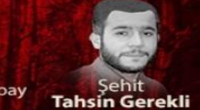
Şehit Tahsin Gerekli