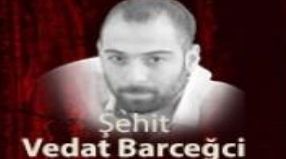
Şehit Vedat Barçeęci